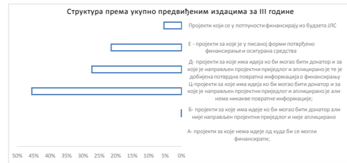
Овај графикон даје визуелни преглед према укупно предвиђеним издацима разврстаним по класама (А-Е) и према финансирању из буџета ЈЛС