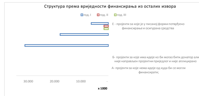
Овај графикон даје визуелни преглед вриједности пројеката планираних из екстерних извора, по годинама и класама (А-Е)