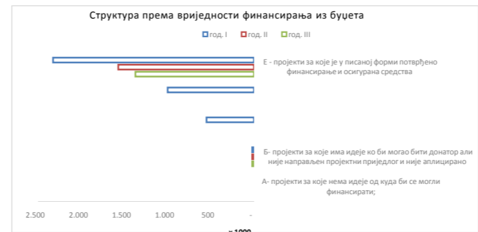
Овај графикон даје визуелни преглед вриједности суфинансирања "екстерних" пројеката од стране ЈЛС, по годинама и класама (А-Е).